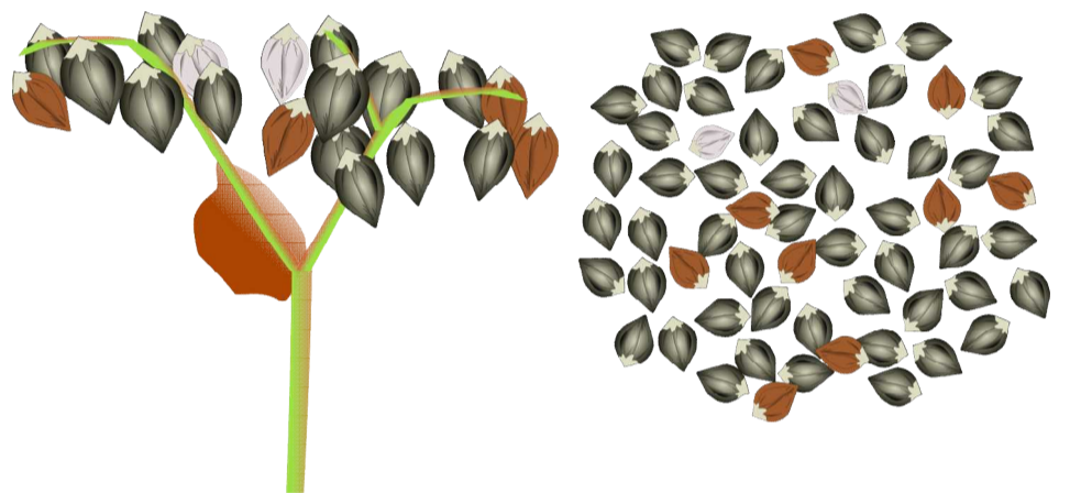
黒化率の判定は最長花房 (一番上の房)で判定する

○ そばは 30 日間かけて順に開花するため、1 粒1粒の成熟は同じではありません。収穫適期は、子実の黒化率(子実全体のうち黒くなった粒の割合)で判断します。